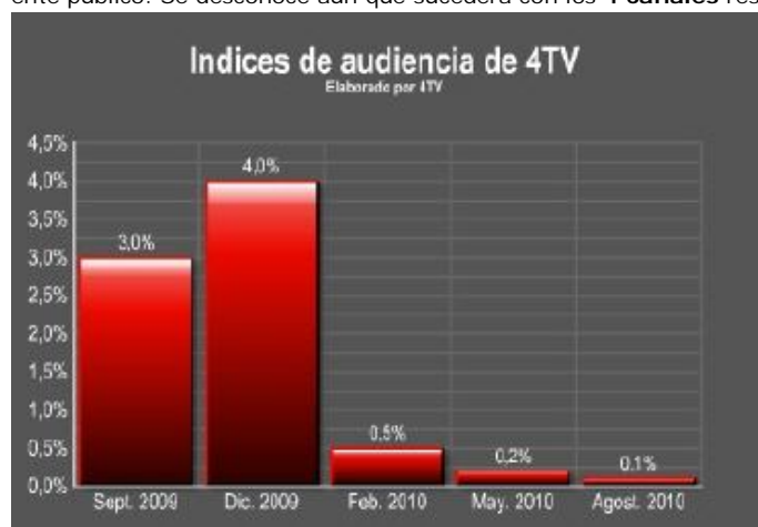
Evolución de la audiencia - (TV4)

Radiotelevisión de Atlántida podría estar interesada en la compra de TV4 para la creación de un canal dirigido al público juvenil que completaría la oferta televisiva del ente público. Se desconoce aún qué sucederá con los 4 canales restantes de TV4 .