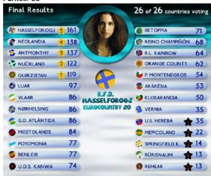
Resultados finales de EuroCountry 20 -