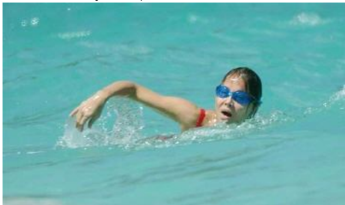
Isabel Preysler nadando en su piscina -

Isabel Preysler regresará al Palacio del Atleneo el próximo 1 de Septiembre . La Vicepresidenta del Gobierno y ministra de la Presidencia del Gobierno, Soraya Saénz de Santamaría , ejerce de presidenta del Gobierno en ausencia de Isabel Preysler .