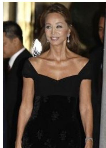
El nuevo libro de Javier Nart -

Isabel Preyler: "Hay que respetar la Constitución"