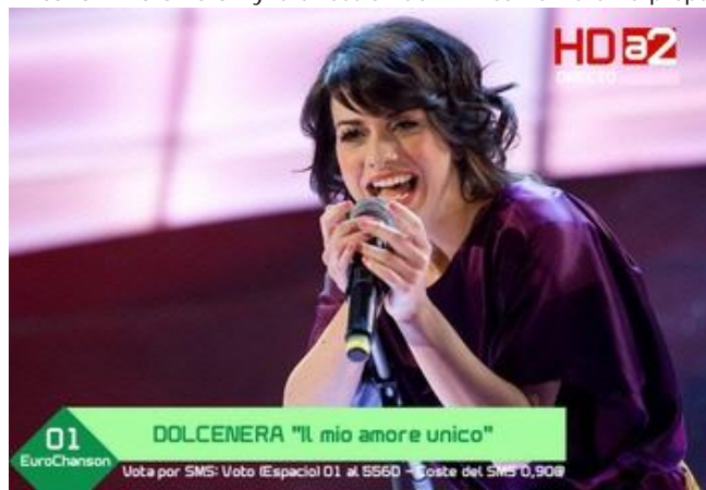
Dolcenera en EuroChanson - (Antena 2 Televisión)

Durante estos días se preparará la puesta en escena que llevarán a Jedhsus City , algo que la dirección de festivales de Antena 2 Televisión y la dirección de TVA comenzarán a preparar en sucesivos días.