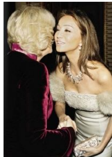
Isabel Preysler -