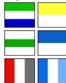
Regiones del G.D. de Atlántida -

El Gobierno pretende modificar el actual modelo territorial por uno más descentralizador . Se estudian varias posibilidades como la de incluir provincias y crear la figura del Delegado Provincial del Gobierno , cargo que desempeñaría funciones como la de gestionar los intereses económicos y administrativos de las respectivas provincias. Cada provincia dispondría de una sede en la que se establecería una diputación .