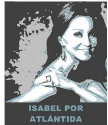
Foto que puede verse en el merchandising de CA -

La presidenta del Gobierno y candidata de CA en las Elecciones Generales, Isabel Preysler , ha decidido recurrir al merchandising para promocionar su candidatura. Camisetas en tallas S, M y XL; tazas; chapas e incluso pins , llevan como imagen a Isabel Preysler con el lema electoral: "Isabel por Atlántida" . Todo este merchandising es regalado gratuitamente en los municipios en los que Isabel Preysler realiza un mitin .