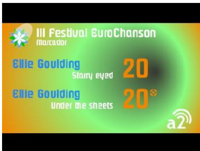
Resultados finales del III Festival EuroChanson - Antena 2 Televisión